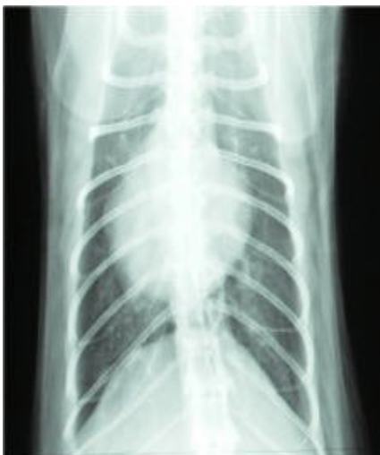
26. November 2003

Chronische Bronchitis zeigt dieselben Symptome wie felines Asthma. Es wird diskutiert, ob Mykoplasmen ein Wegbereiter für felines Asthma sein können. Um eine bakterielle Infektion oder Mykoplasmenbefall auszuschliessen oder zu bekämpfen, verschreibt der Tierarzt ein Antibiotikum, evtl. gekoppelt mit einem Schleimlöser wie z. B. Bisolvon®. Bei chronischen Pneumonien oder Bronchitiden sollte ein Breitband-Antibiotikum wie Baytril® oder Marbocyl® gewählt werden. Sie sollten mit Ihrem Tierarzt besprechen ob eine Behandlung gegen Mykoplasmen angezeigt ist. Geeignete Antibiotika, die auch gegen Mykoplasmen wirken, sind z. B. Zithromax® oder Supracyclin®. Die Antibiotikabehandlung sollte konsequent bis zum Ende durchgeführt und nicht abgebrochen werden. Sie kann mehrere Wochen dauern. Wenn die Katze trotz der Antibiose weiterhin hustet oder nach Abschluss der Antibiose wieder zu husten anfängt, verordnet der Tierarzt als nächsten Schritt oft ein cortisonhaltiges Präparat. Er wird diesen Schritt mit Ihnen besprechen und Ihre Katze nochmals röntgen. Felines Asthma ist eine entzündliche Krankheit der Atemwege; Corticoide bekämpfen Entzündungen sehr effektiv. Wenn eine Katze auf Verabreichung von Corticoiden gut anspricht und dadurch symptomfrei wird, ist das ein Fingerzeig in Richtung der Diagnose „felines Asthma“.