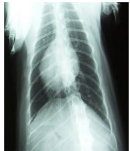
18. August 2004