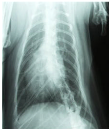
1. Juli 2004

erstellt im Tierspital Zürich, "Diagnose Felines Asthma"